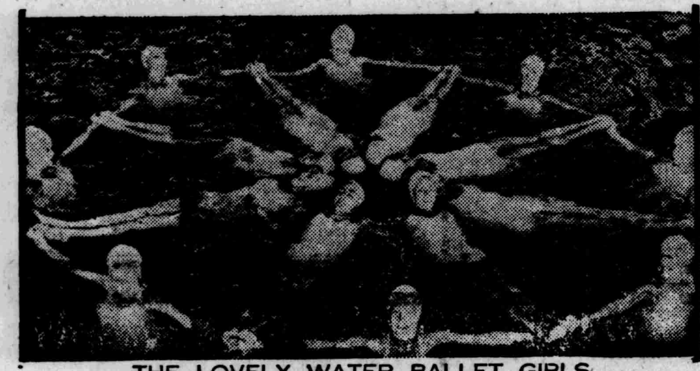
THE LOVELY WATER BALLET GIRLS